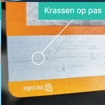
Krassen op pas